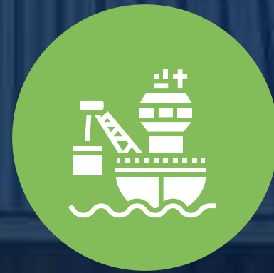
Rayos X Puertos y Aeropuertos