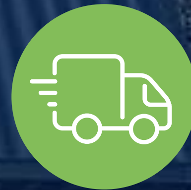
Precintos Electrónicos a Pie de Buque